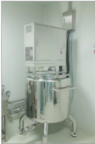
조제 탱크 (상부구동)