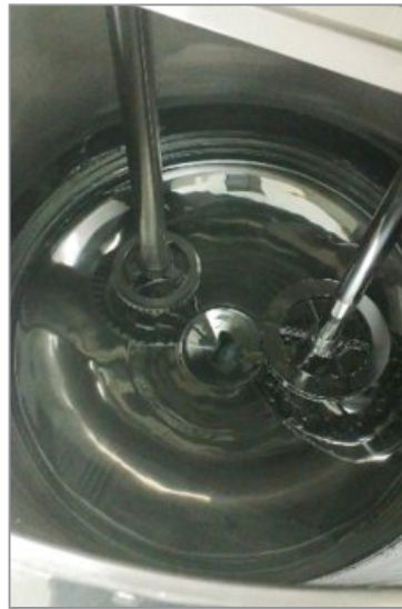
조제 탱크 (상부구동)